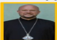
Владика Степан Сус