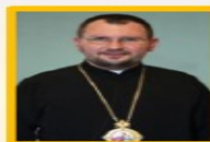
Владика Максим Рябуха