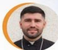
о. Остап Микитчин Філадельфійська Архиепархія УГКЦ