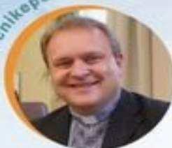
о. о-р Богдан Тимчишин Стемфордська єпархія УГКЦ