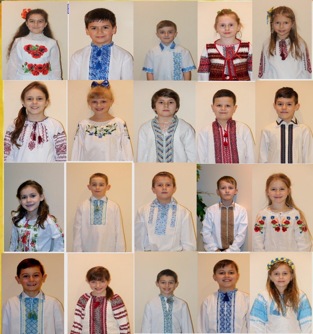
ПЕРШЕ УРОЧИСТЕ СВЯТЕ ПРИЧАСТЯ 2016