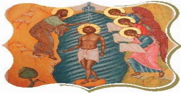
ЙОРДАНСЬКЕ БЛАГОСЛОВЕННЯ ОТЦЯ І ГЛАВИ УТКЦ БЛАЖЕННІШОГО СВЯТОСЛАВА